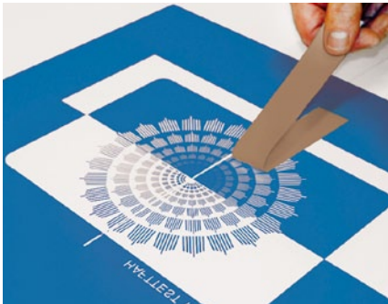
Sehr gute Haftung des Schablonenmaterials auf dem SEFAR® SWM Gewebe

SEFAR® SWM erlaubt hohe Spannwerte mit allen handelsüblichen Spannsystemen. Wir garantieren ein ausgewogenes Dehnungsverhalten in beide Spannrichtungen – Kette und Schuss, resultierend in einer ausgezeichneten Dimensionsstabilität. Gleichzeitig garantiert die gute Dimensionsstabilität reproduzierbare Spannwerte für hohe Druckauflagen.