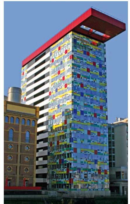
Gedruckte Spiegelung «Kölner Dom» auf der Glasfassade «MediaPark» Köln, Deutschland