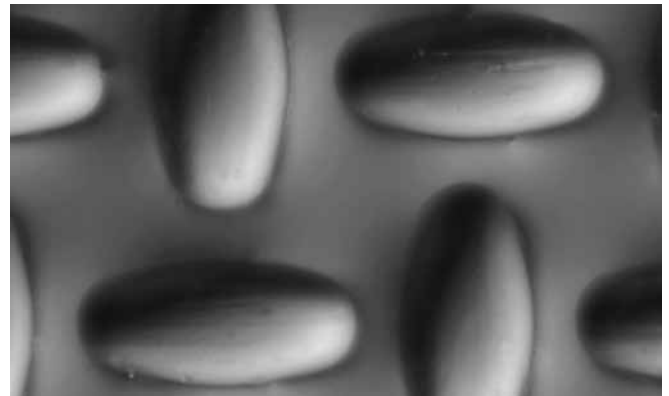
SEFAR® PA nach 5.000 Drucken

SEFAR® PA zeichnet sich durch seine exzellente Abrasionsbeständigkeit aus und eignet sich daher für Anwendungen mit stark abrasiven Farben und rauen Oberflächen; zum Beispiel beim bedrucken von Fliesen.