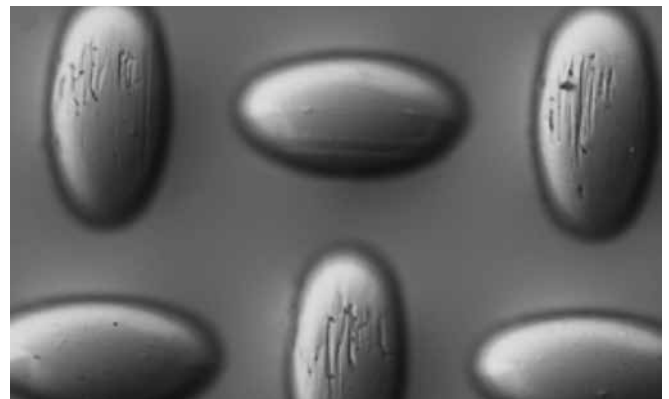
Standard PET Gewebe nach 5.000 Drucken